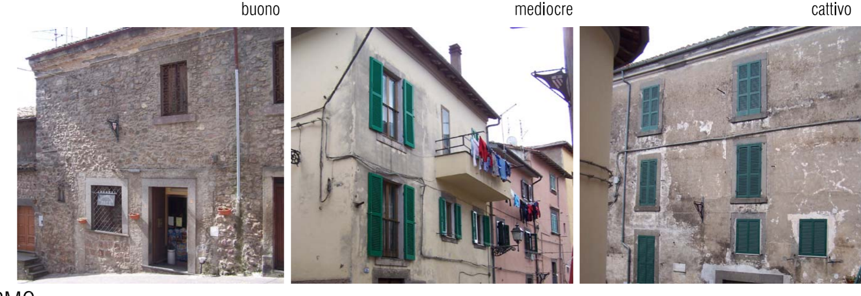
VIA DELLA MADONNA DI MARMO