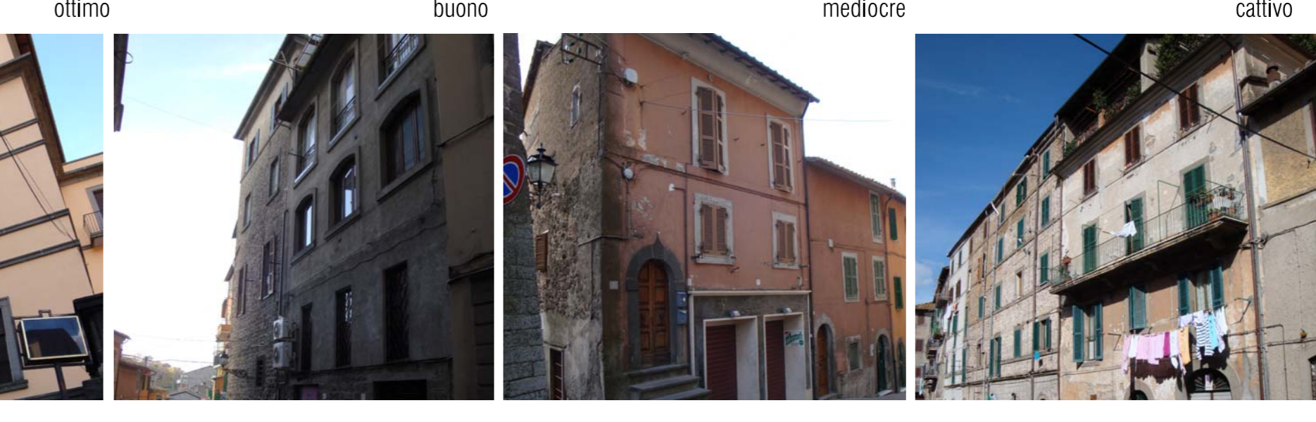
VIA DELLA ROCCA