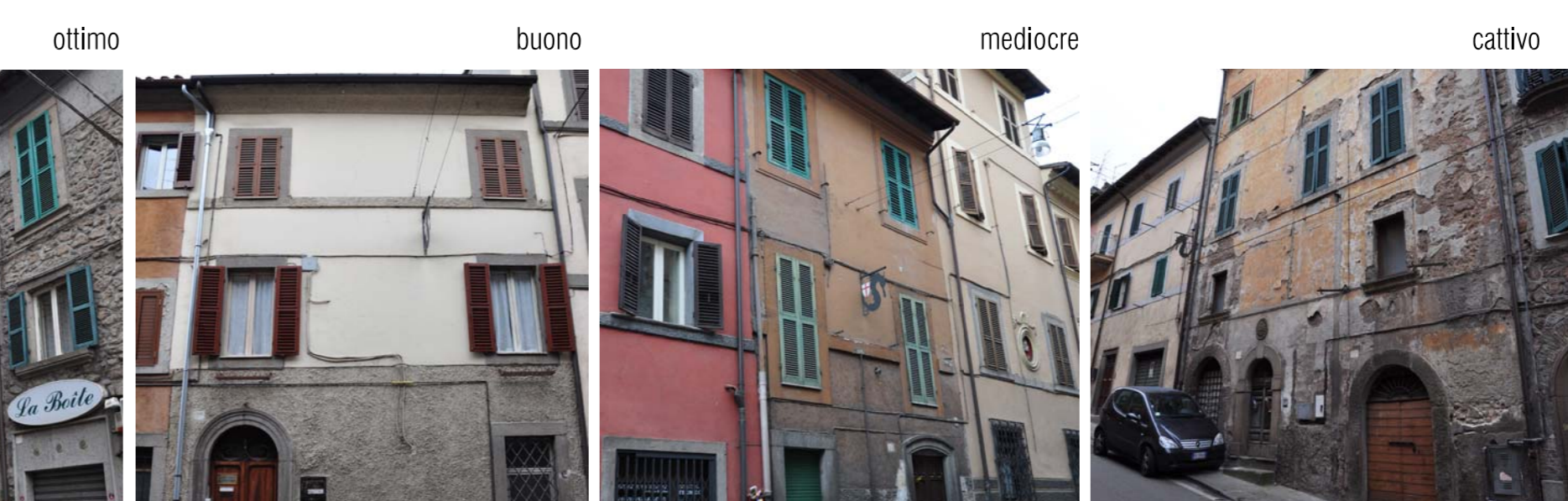
VIA SANTA MARIA