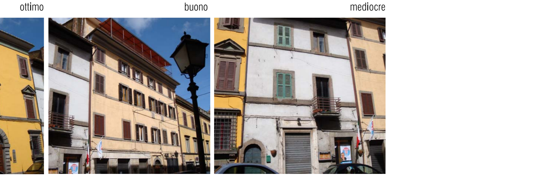
VIA INNOCENZO VIII